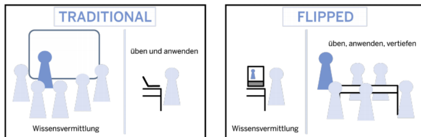
Abb.: Traditional Classroom - Flipped Classroom (Entwurf: QUA-LIS NRW)

während der Flipped Classroom sich als geeignete Sonderform dessen erwiesen hat. Dabei wird die Wissensvermittlung in die selbstständige Arbeit in der Distanzphase gelegt und die Übung, Anwendung und Vertiefung findet, im Gegensatz zum traditionellen Lernen, in den Präsenzphasen statt (vgl. Abb. 2).